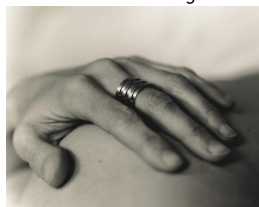
3. Florence Croisier : Bague Destins croisés en argent