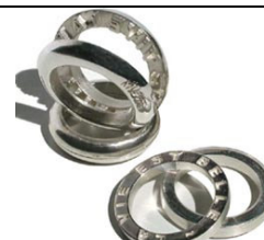
2. Agathe Saint-Girons : Anneaux Confidences en argent ou or