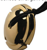
4. Sébastien Parfait : Pendentif « Champagne », or jaune

La galerie a, dès sa création, voulu briser le cercle vicieux du «pas d'image valorisante, pas de demande, donc peu de bijoux pour l'homme» et a été suivie par ses créateurs, qui ont produit une collection extrêmement diversifiée, sobre ou sophistiquée, d'objets de 90 à 7000 euros.