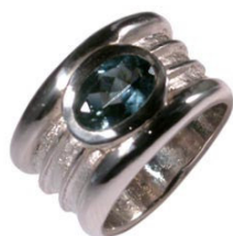
Hélène Courtaigne Platine

Les bijoux pour hommes peuvent être visualisés sur le site internet www.elsa-vanier.fr